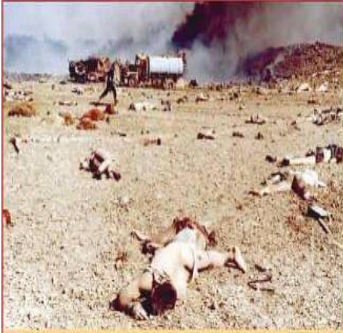
■ Patlamadan yarım saate önce tararlara döndü. İnanılmaz parçalanmış bedenleri kızıla suçtu. Maruzları korkuttu.