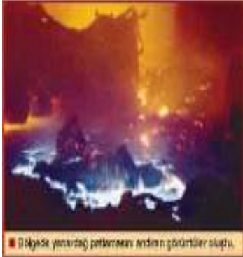
■ Bölgede yarı saatte patlamadan önceki görüntüler olduğu.