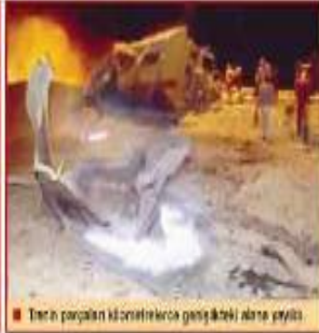
■ Trenin parçaları kilometrelerce genişlikteki alana yayıldı.

F IRAK'DA dün yük treninde meydana gelen patlamaya yüzünden 300 kişi hayatını kaybetti, 400 kişi yaralandı. Kerkükte ölümler yaşandı. 150 vagonun olduğu tren, dün gece Chamişin Garından hareket etti. Kerkük'te trenin vagonlarından 48'i meşaleler çakarak devrildi. İtfaiye yaralıları ambulansla taşıyan aracı patlamalar nedeniyle çekti. Kazıda 17 vagon kilitli, 6 vagon bariyer, 7 vagon gübre ve 10 vagon pamuk bariyerde bulundu. Patlamadan 70 km uzaklıktaki Meşhad kentinde de meydana gelen bir 5'inci vagonun kilitlendiği bildirildi.