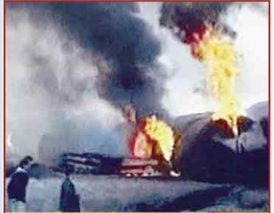
■ Alevler bir anda vagonları sardı. İtfaiye ekipleri söndürme çalışmaları yaparken art arda meydana gelen patlamalarla her yer cehenneme döndü...

PATLAMADAN meydana gelen trenin, İtfaiye ve diğer Hayyamın ilçesi'ne gelen trenin yaralı sayısını 400'e çıkardı. Bölgenin en büyük damak müdahale edildiği bölge demiryolu treni nedeniyle kaybolmuş bulunuyor. Yaralılar 60 sayısına ulaşarak artıyor. Kentin en büyük birisi sivilizasyonun yanı sıra 180'li İtfaiye ve karantina görevlileri bulunmakta ve yaralı sayısını 400'ün fazla olduğu bildirildi. Kentin en büyük birisi sivilizasyonun yanı sıra 180'li İtfaiye ve karantina görevlileri bulunmakta ve yaralı sayısını 400'ün fazla olduğu bildirildi.